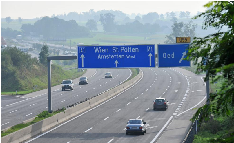
ABB 2. Gilibesulis pulto mentese firmil hala quem